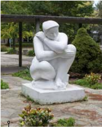
Sculpture en pierre (vers 1966) d' Antoniucci VOLTI (hauteur 2,40 m environ).

Entre les ré-inventions d'un art figuratif qui s'éloigne de l'académisme et les explorations de l'abstraction, les œuvres du 1% témoignent de leur ancrage dans les débats artistiques de leur époque. La diversité des approches et la dispersion des œuvres ne facilitent pas leur appropriation, alors qu'à l'échelle régionale, le corpus représente un panel remarquable de la production d'artistes d'envergure nationale et internationale.