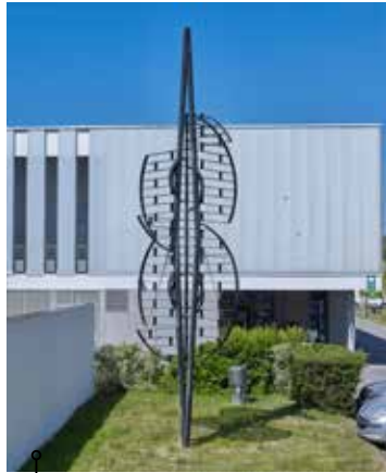
Stabile , sculpture métallique (vers 1962, reconstituée en 1993 dans les ateliers du lycée), de Francis PELLERIN . Le titre de l'œuvre est une contraction de stable et mobile (hauteur 8 m environ).

📍 Lycée Jacques Cartier, Saint-Malo (35)